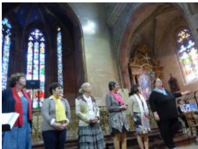
Les chefs de chœur des 6 diocèses présents

La présence de Mgr Gardès durant toute cette journée a été grandement appréciée par les choristes.