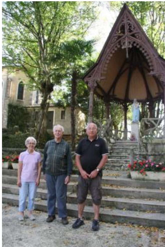
Les Amis de Tonneteau devant la chapelle

Mais l'état la chapelle extérieure est préoccupant, la charpente et la toiture donnant d'inquiétants signes de fatigue par le pourrissement du bois, du chêne certes, mais plus que centenaire. Il est donc nécessaire de refaire la totalité de la charpente et de la toiture. Le devis s'élève à quelque 20 000 € que l'association s'engage à financer à 50 %.